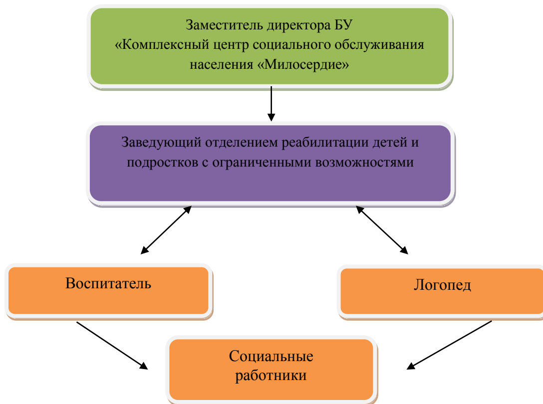
Рис. 3. Контроль и управление программой

Реализацию программы контролирует заместитель директора бюджетного учреждения Ханты-Мансийского автономного округа – Югры «Комплексный центр социального обслуживания населения «Милосердие». Координирует реализацию программы «Волшебные краски» заведующий отделением реабилитации детей и подростков с ограниченными возможностями.