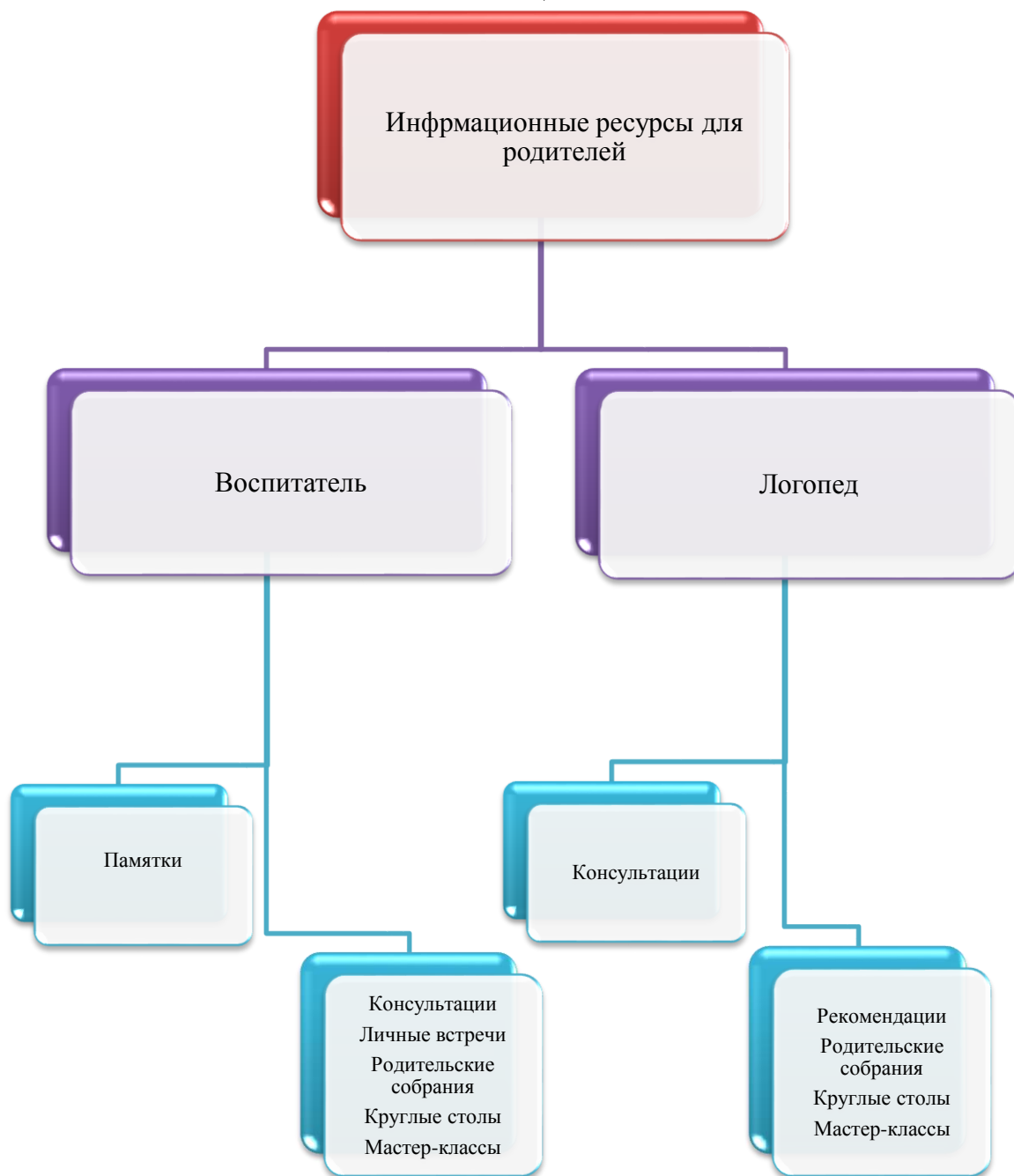
Рис. 2. Информационные ресурсы